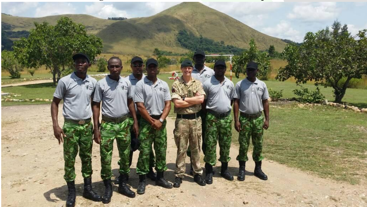
Figure 2: Instructeur principal britannique avec les conservateurs