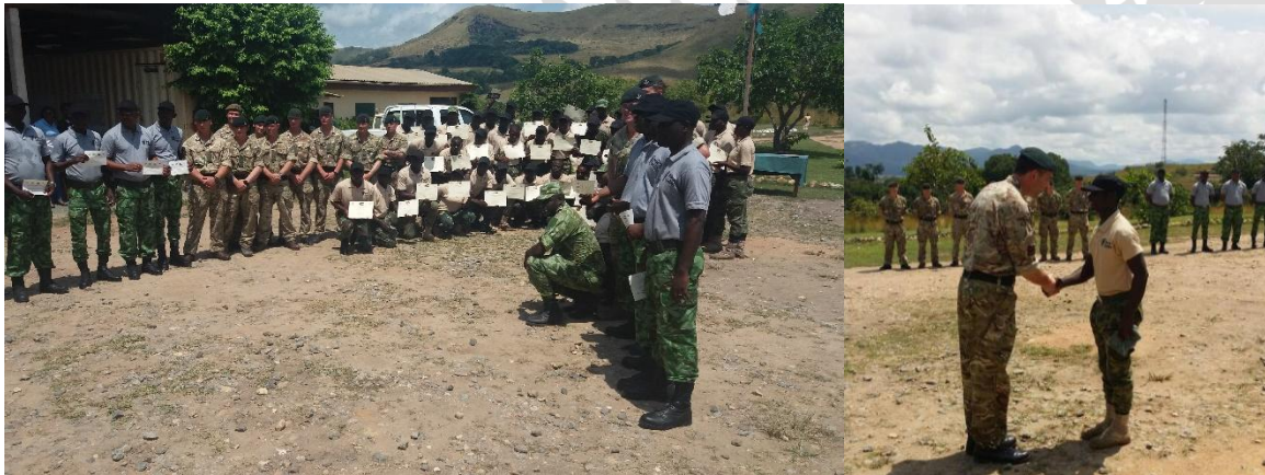
Figure 7: Photo de famille et remise du parchemin au meilleur tracker (pisteur)

A chaque fin de session une cérémonie de remise des parchemins a lieu, elle est rehaussée par la présence des cadres de l'ANPN et des Colonels de l'armée britannique qui viennent spécialement pour la circonstance comme le montre les images ci-dessous.