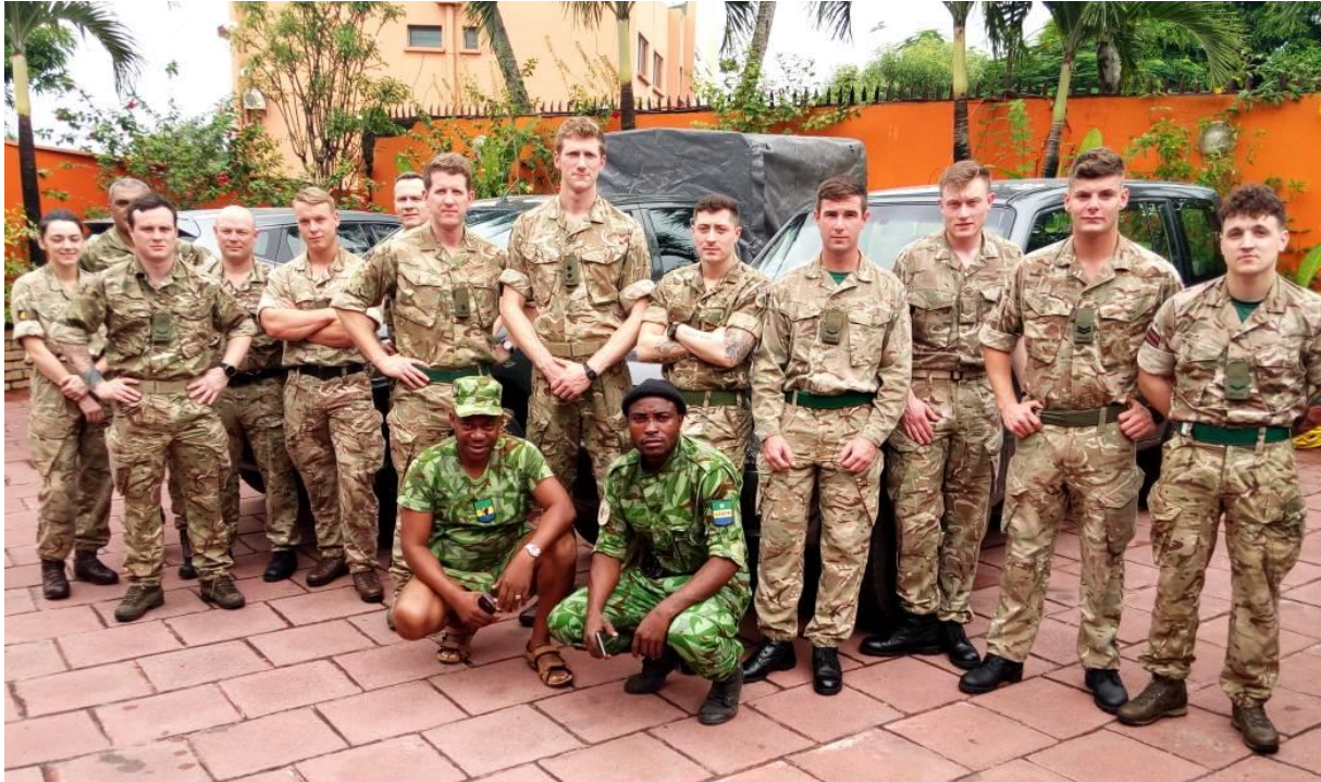
Figure 1: Instructeurs de l'armée britanniques