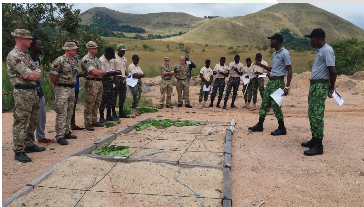
Figure 6: Modèle de terrain (Bac à sable)

Avant la mission, les équipes ou l'équipe doit connaître où, quand, pourquoi, comment la mission se déroulera. Généralement, il faut une représentation du terrain qui fera l'objet de la mission (Carte, bac à sable) (Fig. 5). Au sorti de la mission l'équipe doit débriefer avec sur déroulement de la mission. Il faut sortir ce qui a bien marché et ce qui n'a pas marché et pourquoi.