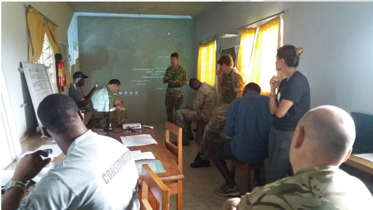
Figure 4: Formateurs et formés au Centre des Operations de la formation

Cette planification doit se faire dans un endroit hautement professionnel et neutre, préférable au centre des opérations.