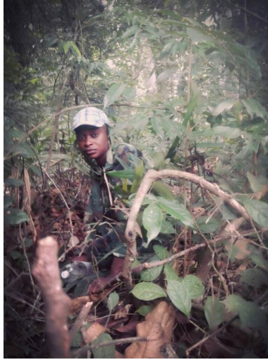
Figure 3: Camouflage d'un apprenti éco garde